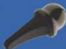
NOUVEAU : NuGrip CMC