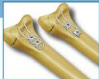
Volar Buttress Pin™ and Wire Plate™